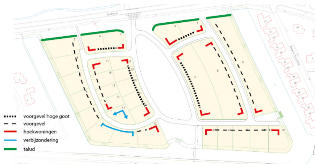
Ligging voorgevels en accenten in de buurt.

De vormgeving en detaillering is tijdloos en niet modieus. Het heeft oorspronkelijkheid.