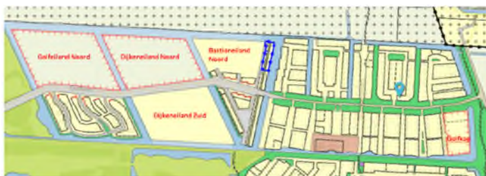
De buurt Golflaan

De buurt Golflaan omvat het grootste deel, met nu reeds ruim 400 woningen. De 2 e fase van de Golflaan (het deel westelijk van de Johannes Vermeerlaan) is aan snee gebracht in de 2 e helft van de jaren 2000. Dit deel omvat de 'eilanden'. Het Bastioneiland, Dijkeneiland en Golfeiland. Daarvan is inmiddels het Bastioneiland nagenoeg volledig ingevuld. Ook het zuidelijk deel van Golfeiland heeft zijn beslag gekregen.